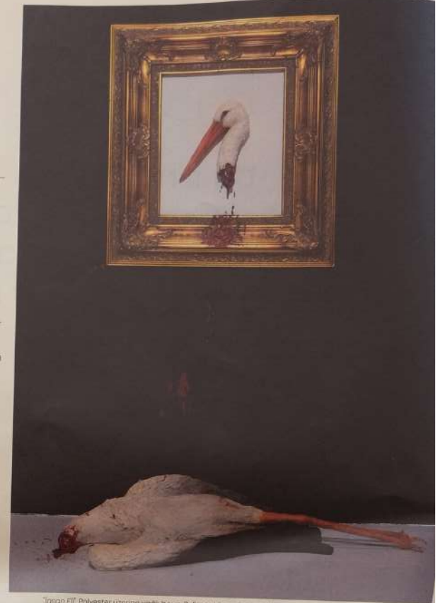
"Tiranın Eyle" Polyester üzerine yağlı boya Polimer kil üzerine yağlı boya. Çerçeve: 160 cm x 140 cm x 70 cm, 2022

Özellikle insanın insana değil, hayvanlara, canlılara ve doğaya yaptığı eziyet, doğaya ve canlılara hükmetmesi, kendini üstün görmesi ve bu motivaşyonla attığı tüm adımlar şu an içinde bulunduğumuz geleceğindeki sistemi oluşturuyor. Nereden bakarsan bak Hawking'in söylediği gibi bu dünyamız en fazla 200 yılı var. Bu gezegeni sömüren marifetlerini konu aldığımız birçok kapak yaptık ArtDog'a. 2019 yılının Eylül ayında ilk sayısını başlattığımız ArtDog "Çöplüğü Çevirdiğimiz Dünya" ve Kıyamet... "Nefes Alamıyoruz" "Tehtikeli Kırmızı" başlıklı kapak ve manşetleri yaptı. Bir kültür sanat yayınına ama neredeyse kafamız çevirsek insanın yu açtığı vahşetin ve yılanın izlerini görüyoruz. Özellikle hayvanlar ve doğa bağlamında sormak istiyorum sana insanın